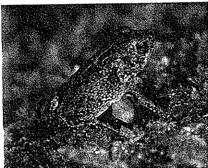
非常に小さな上陸したばかりの幼体