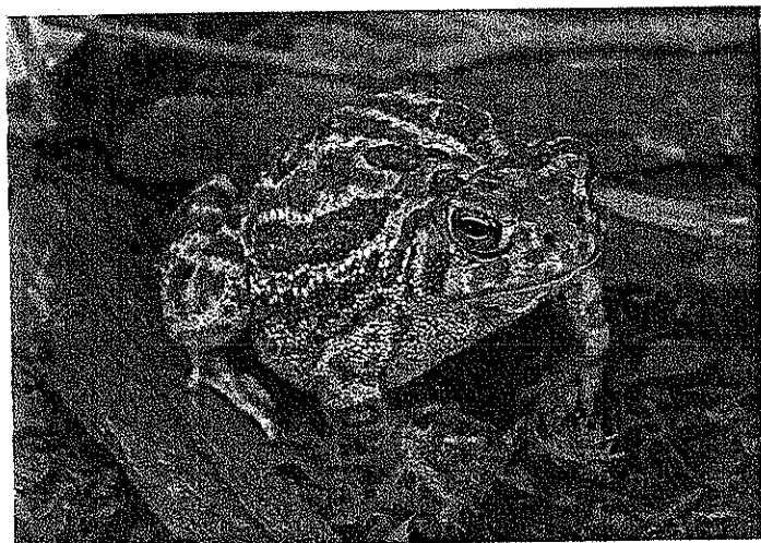
どっしりとした体型のボリュームあるヒキガエル。背の暗色の模様は左右対称