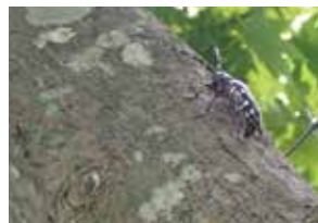
カエデ被害木 産卵しているメス成虫