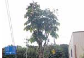
トチノキ被害木 枝枯れし樹皮が落ちている