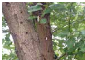
ヤナギ被害木 産卵痕と樹液浸出がみられる

ツヤハダゴマダラカミキリはさまざまな広葉樹を加害することで、世界的によく知られています。国内では、ヤナギ類、ニレ類、カツラ、サクラ、トチノキ、カエデ類の被害がこれまでに報告されています。特に被害が多いのが、アキニレ、カツラ、トチノキ、ヤナギ類で、これらの木の幹や枝にまん丸の穴があいていたら、本種がそこにいる可能性があります。