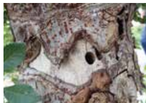
アキニレ被害木 脱出孔が樹皮の落ちた所にある