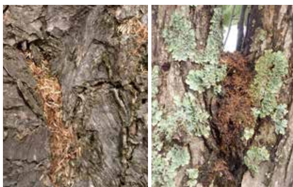
ツヤハダゴマダラカミキリのフラス

ツヤハダゴマダラカミキリは、知らない間に地域に入り込んでしまいます。見た目が在来のゴマダラカミキリに似ているため、成虫を見ても外来種だとは気づけず、沢山の木が同じように弱ってきて、ようやく、この虫の侵入のためだと判明することがよくあります。まだ、日本への侵入が見つかったばかりの虫なので、木を伐らないで虫だけを取り除く方法は、まだよくわかりません。この虫を駆除するには、成虫が木から出てくる前に被害木を伐採し、燃やすか細かくチップにするしかないのです。前述の脱出孔や産卵痕で被害木を探す以外に、幼虫が出す木屑とふんの混合物(フラス)が樹皮からこぼれ落ちることも、この虫が樹木の中にいることのサインとなります。加害が激しくなると樹皮がはがれ始めて、本種のフラスがみられるようになります。