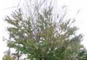
カツラ被害木 上部から枯れている