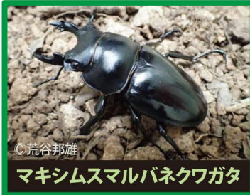
マキシムマルバネクワガタ