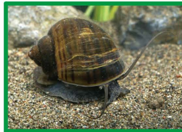
スクミリンゴガイ