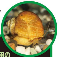
かんしょう用の ゴールデンアップルスネール

つかまえても、他の場所に持って行かないでね。飼っている貝は、池や川に放さないでね。