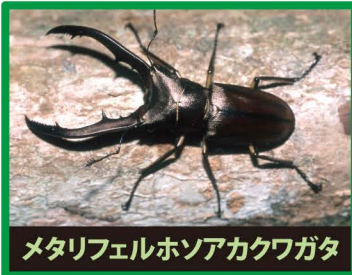
メタリフェルホンアカクワガタ

野外に出ると、日本のカブトムシやクワガタの餌やすみかをうばったり、交雑したり、昆虫の病気を広めたりします。