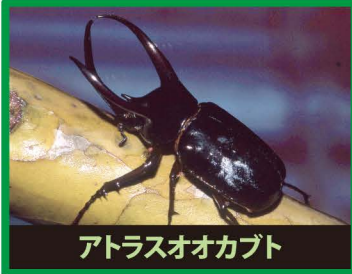
アトラスオオカブト