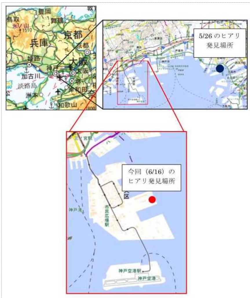
■5/26にヒアリが確認された場所及び6/16にヒアリが確認された場所