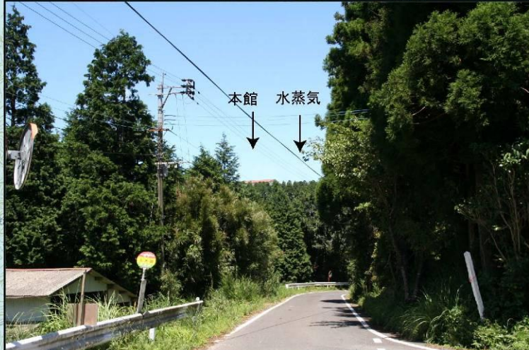
調査地点② 大霧集落

・発電所に最も近い国立公園内の集落から眺望した景観であり、樹林の向こう側に本館屋根の一部や冷却塔からの水蒸気が眺望される。(直線距離で460m) ・冷却塔の水蒸気は高さが20m程度を超えると眺望される。