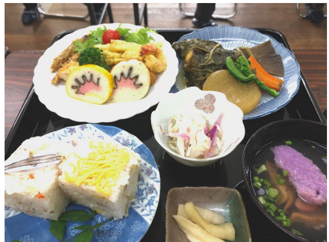
地元食材で作った節句料理

島全域がエコツアーリズム推進地域であるため生活環境保護のために地域住民とのコミュニケーションが重要です。このためエコツアー参加者と地域住民とが積極的に関わりを持てるプログラムを開催するとともに、地元で栽培された野菜や水揚げされた魚介類などの積極的な活用により、地域住民の積極的な参加を促すエコツアーを実施します。