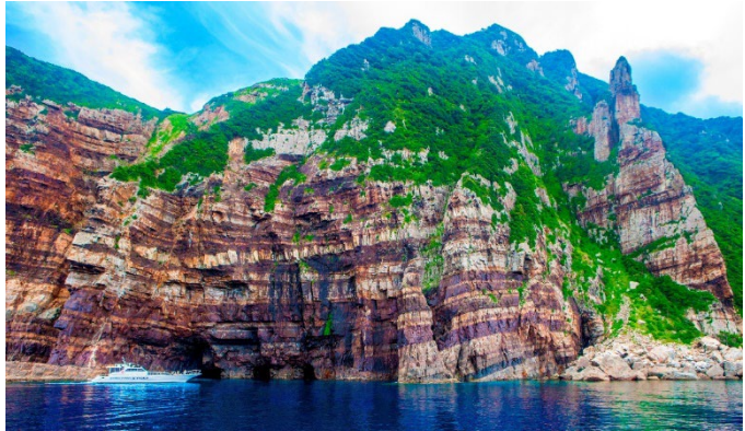
8,000 万年前の地層・鹿島断崖

甌島は、鹿児島県薩摩半島の西方約 26 km の東シナ海上に位置し、北東から南西方向に上甌島・中甌島・下甌島と約 35 km に 3 つの有人島を中心に形成されている列島であり、8000 万年前の姫浦層群の地層が剥き出しになっている鹿島断崖、陸繋砂州（トンボロ）や 3 つの池と東シナ海とが砂州で区切られた天然記念物の長目の浜など、多様な自然海岸を有する陸域と海域を中心とし、「太古の地球を感じる宝の島」をテーマに、平成 27 年 3 月 16 日に国立公園に指定されました。