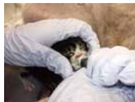
子猫の一時預かりボランティア