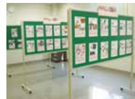
隣接する自治体との譲渡前講習会の連携 ※写真は譲渡犬猫写真展の様子