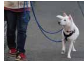
譲渡候補犬のお散歩ボランティア