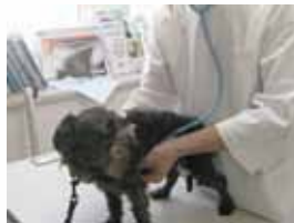
獣医師による健康診断

※他にも様々な取り組みが実施されています。お住まいの自治体にお問い合わせください。