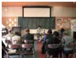
飼育講習会の様子