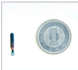
マイクロチップ実物大

茨城県動物指導センターが主催する子犬の譲渡会で譲渡する子犬にはすべてマイクロチップが埋め込まれてから一般に譲渡されます。平成19年10月から、県の獣医師会の協力で行われているもので、獣医師会が物資と登録料を負担し、センターの職員(獣医師)が埋込み作業を行っています。マイクロチップは迷子や脱走、緊急災害時や不慮の事故、盗難防止に威力を発揮し、飼い主との再会率を高めます。マイクロチップの埋込みは犬では、生後2週令、猫では生後4週令から可能と言われています。