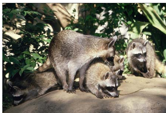
【カニクイアライグマ】