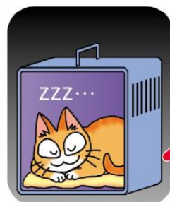
ふだんからクレートを寝床にしておけば...

を確かめておきましょう。避難所ではたくさんの方が生活することが予想されます。中にはペットが嫌いな人やアレルギーをもつ人もいますので、普段からペットは清潔にし、必要なしつけをするなど、他人に迷惑をかけない配慮がペットの安全につながります。