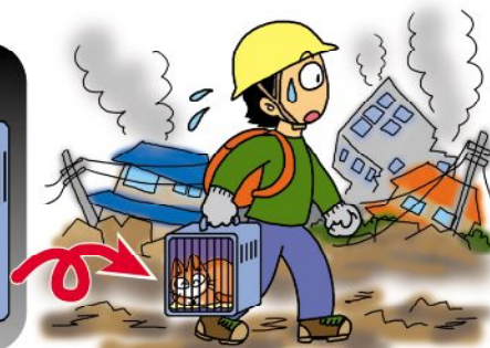
いざという時もストレスを減らせる