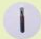
実寸大の マイクロチップ

マイクロチップは、直径2mm、長さ8～12mm程度の円筒形の電子標識器具で、内部はC、コンデンサ、電極コイルからなり、外側は生体適合ガラスで覆われています。