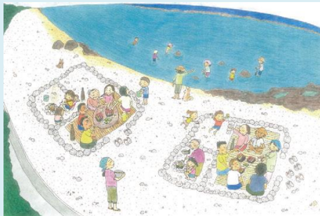
(出典: 石垣島沿岸レジャー安全協議会 「あんなだったよ～石垣島」2015 イラスト=笠原利香)