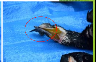
飲み込む寸前の魚