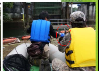
湖面のカワウの回収作業