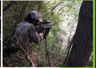
イーグレットオフィスによる カワウシャープシューティング