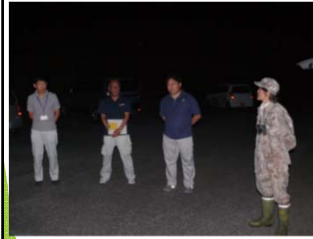
日の出前の関係者による ミーティング・KYの実施