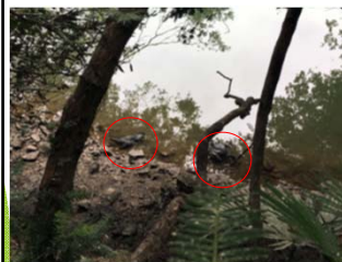
湖面に浮かぶ回収前のカワウ