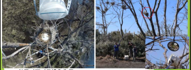
ドライアイス投入作業