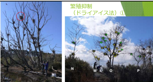
ドライアイス投入作業（12mの釣り竿）