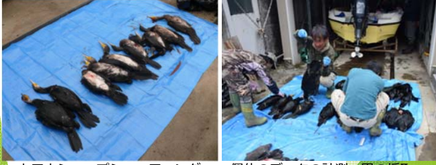
カワウシャープシューティングによる捕獲個体