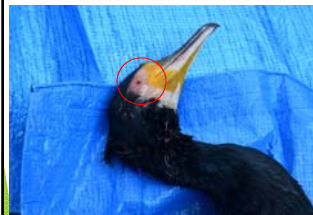
カワウシャープシューティングによる捕獲個体(赤丸は空気銃の弾痕)