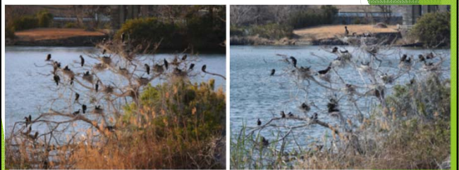
ドライアイス投入作業前