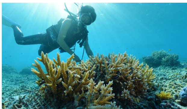
コーラルネットによるサンゴ再生