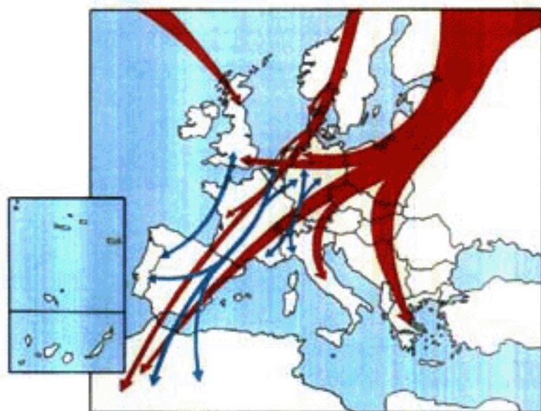
ヨーロッパにおける鳥類の代表的渡りルート

EUレベルで重要な野生生物種を「絶滅のおそれのある種」「危急種」「希少種」等のカテゴリーに従って分類し、生息地の確保を中心に、各国はその保護・回復措置を講ずることにより、ヨーロッパ・エコロジカル・ネットワークの形成に寄与することとされています。