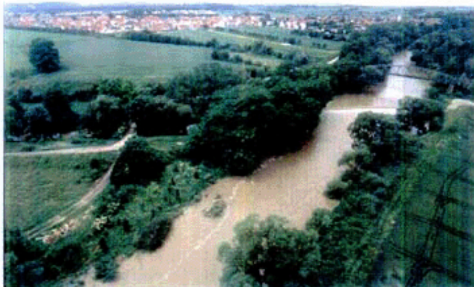
カールスルーエ市では、市内を流れる2つの河川と緑量感ある河畔林を緑地システムの骨格に位置づけている。