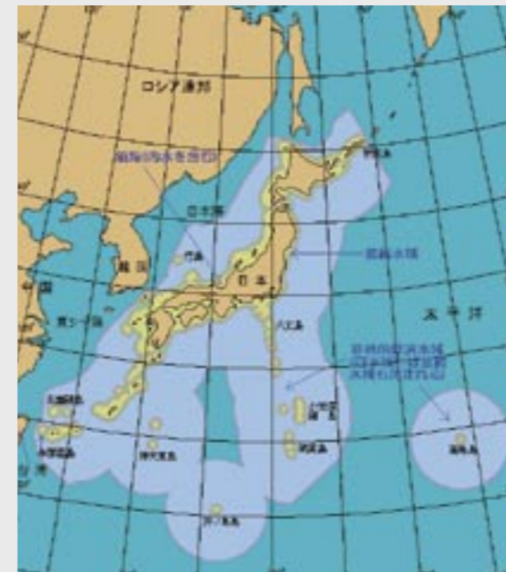
図3 日本の排他的経済水域。沖ノ鳥島が有する経済水域は、日本の国土（37万km 2 よりも広い）。