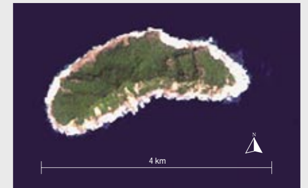
図4 尖閣諸島釣魚台の地形図（Landsat ETM+）