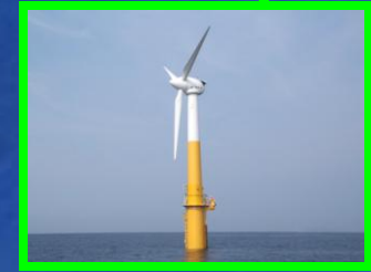
Floating Offshore Wind Turbine Demonstration Project