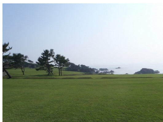
Tanesashi Coast (Tanesashi Turf) 種差海岸(種差芝生地)