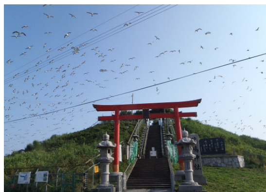
Kittiwakes flying over Kabushima ウミネコの飛び交う燕島

The itinerary might be changed due to bad weather. コースについては、天候等により変更する場合があります。 Bring raingear when forecast is not good. 雨などが想定される場合、雨具を持参してください