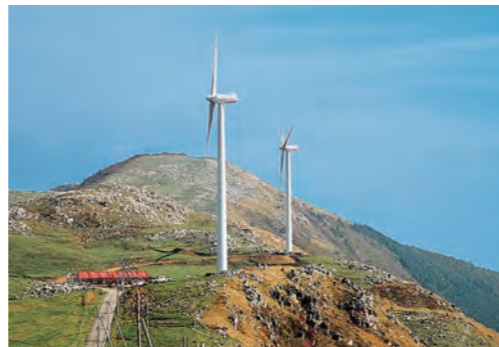
風力発電用の風車

一度利用してもまた繰り返し使えるエネルギーのことを再生可能エネルギーと呼んでるんだ。石油や石炭なんかに代わるクリーンなエネルギーなんだよ。