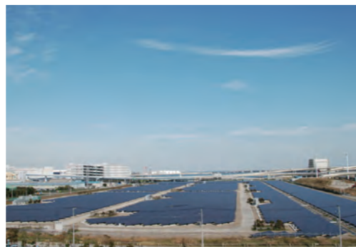
メガソーラー