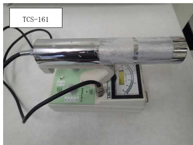
図.5 NaI (Tl) シンチレーション式サーベイメータ