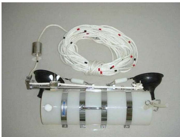
図.7 バンドーン型採水器