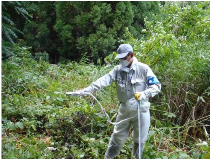
図.6 空間線量率の測定 (例)