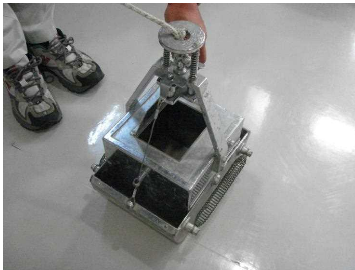
図.2 エクマンバージ型採泥器