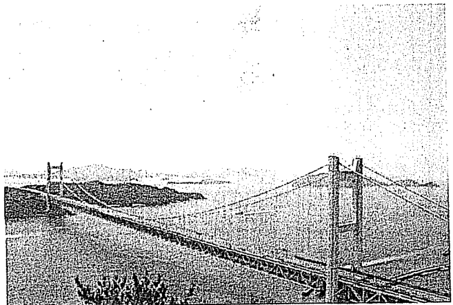
鷲羽山山頂より塩飽諸島 及び瀬戸大橋を望む