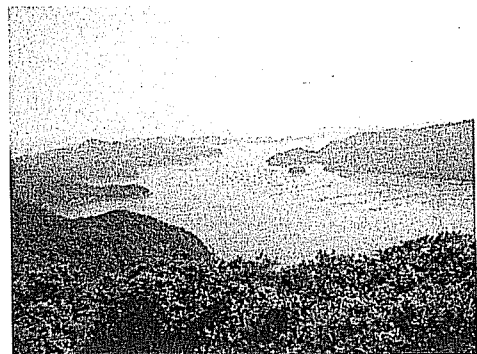
夕立受山園地(展望塔)から望むカキ筏の浮かぶ多島海