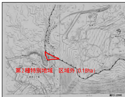
鳥取県鳥取市浜坂