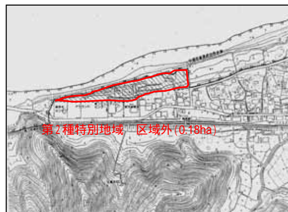
鳥取県岩美郡岩美町陸上