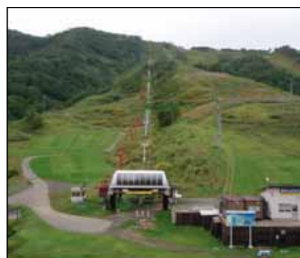
ヒラフ索道運送施設