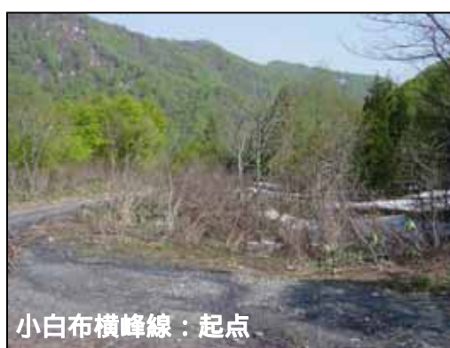
小白布横峰線：起点