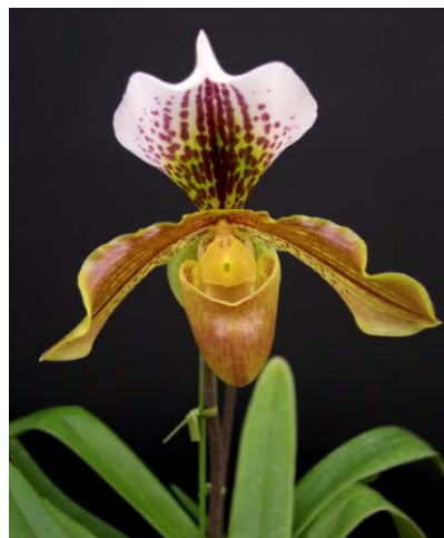
<パフィオペディラム・シンジユク (ラン科の植物)> (皇室苑地時代に作出された品種)