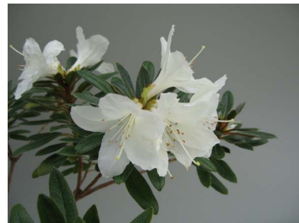
<ムニンツツジ> (小笠原の絶滅危惧植物)