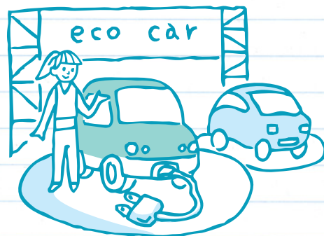
イラストレーション/タニダリョーコ

5月17日（土）、18日（日）に神戸メリケンパークで開催された「エコカーワールド2008 in 神戸」では、最新のプラグインハイブリッド車などエコカー約90台を集め、展示や試乗を行うとともに、三宮と元町からエコカーの無料シャトルバスが会場間を運行しました。6月7日（土）、8日（日）に開催される「エコカーワールド2008 in 横浜」でも、神戸同様にエコカーの展示や試乗が行われ、桜木町よりハイブリッド車などの無料シャトルバスが運行されます。自分のエコドライブ度が分かるエコドライブシミュレーターなど、エコカーに関するさまざまな体験ができるこのイベントに是非ご参加ください。