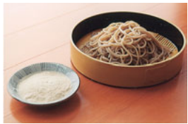
風味のよい雪中そばは、町営の「ほろしん温泉ほたる館」で食べられる。