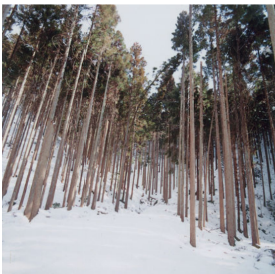
地元から寄付された演習林。雪で曲がってしまった雪害木も、木材として活用する。