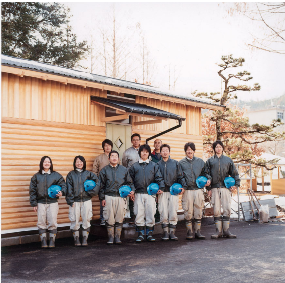
地元産の木材を使った、もうすぐ完成するログハウスを前に。

路面電車の活用や、廃油から作るバイオ燃料生産、温泉の廃熱エネルギー利用……。今、日本各地では、地域の特性を活かしたさまざまな温暖化防止の取り組みが行われている。環境省は、地域の試みをより活発なものにするため、各地の地球温暖化防止活動推進センターと協力して「ストップ温暖化「一村一品」大作戦」を昨年開始した。この「大作戦」には、全国各地から1074件の応募が集まり、今年2月に開催された全国大会では、都道府県代表に選ばれた47の団体が、それぞれ自慢のユニークな取り組みを発表した。