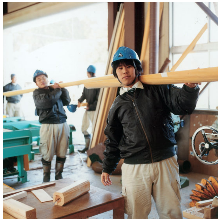
重い木材も、すべて自分たちの手で運ぶ。