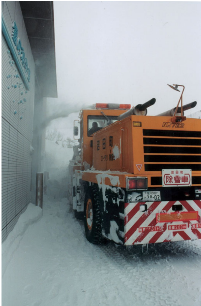
除雪車で、貯雪庫に雪を入れていく。