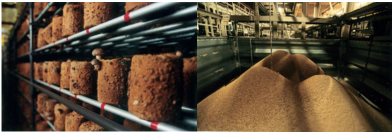
今年春から、雪冷房が導入される椎茸の栽培施設。