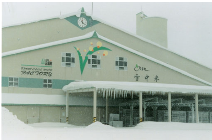
スノークール ライスファクトリーの外観。

から送られる冷熱で室温5℃、湿度70%に調節するという仕組みで、庫内に置かれた米は劣化することなく鮮度を保ったままが続くのだという。その証拠に、毎年およそ8万俵作られる雪中米は、すべて完売するほどの人気だ。この雪冷熱を利用して、米のほかにも、そばやじゃがいもといった農産物のほか、みそ、酒などの加工品も「雪中商品」として、町の特産物となっている。雪で冷やされたそばの実は、風味が増して新そばの味と香りが保たれ、じゃがいもは水分量はそのまま甘みが増していく。この「雪中じゃが」と「雪中米」は少量ながら台湾にも輸出され、売れ行きも好調だ。