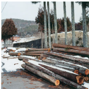
生徒たちによって、演習林から切り出された杉の間伐材。