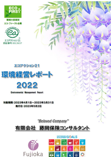
エコアクション21 環境経営レポート