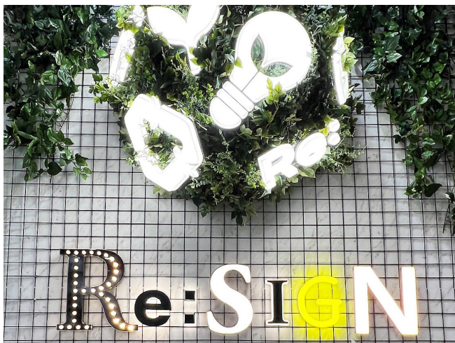
リサイクルアクリル使用の LEDサイン「Re:SIGN」