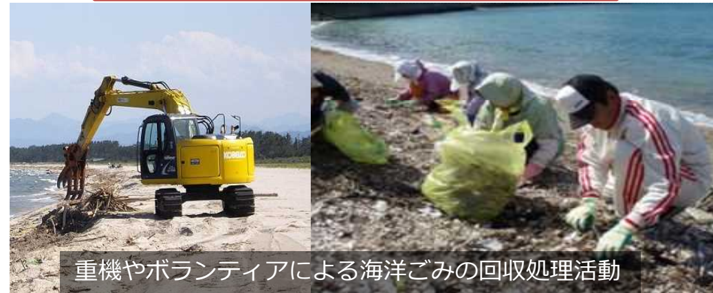
重機やボランティアによる海洋ごみの回収処理事業活動