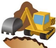
一時埋設イノシシ等の処理