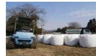
農林業系廃棄物(稲わら、牧草等)