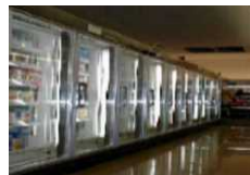
<冷凍冷蔵ショーケース>