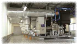
<中央方式冷凍冷蔵機器>