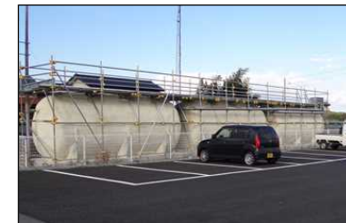
【応急仮設住宅に設置された浄化槽】