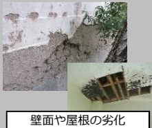
壁面や屋根の劣化