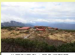
公園利用者の緊急避難所