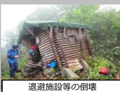
退避施設等の倒壊