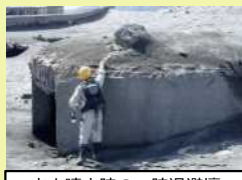
火山噴火時の一時退避壕