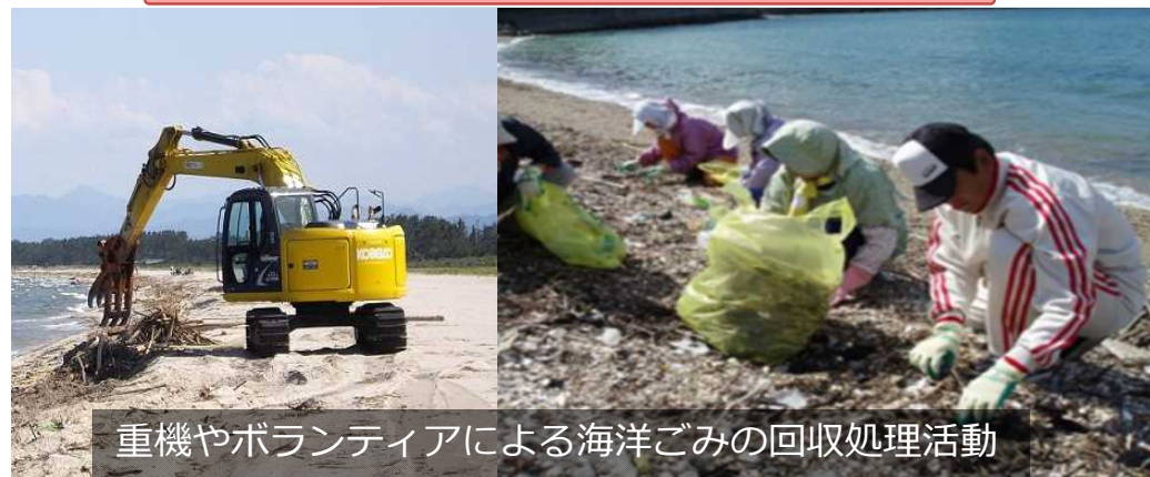
重機やボランティアによる海洋ごみの回収処理事業