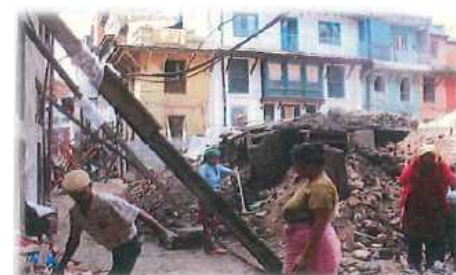
地震による建物の崩壊(地震)

災害時に一度に大量に発生する災害廃棄物を適正に処理できない状況となっており、生活環境や公衆衛生の悪化だけでなく、資源効率の観点からも改善すべき状況