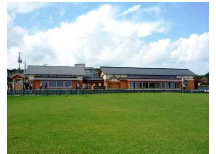
公園編入地域（青森県）の 集団施設地区整備 （種差海岸 インフォメーションセンター）