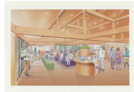
トレイルセンター （整備イメージ）