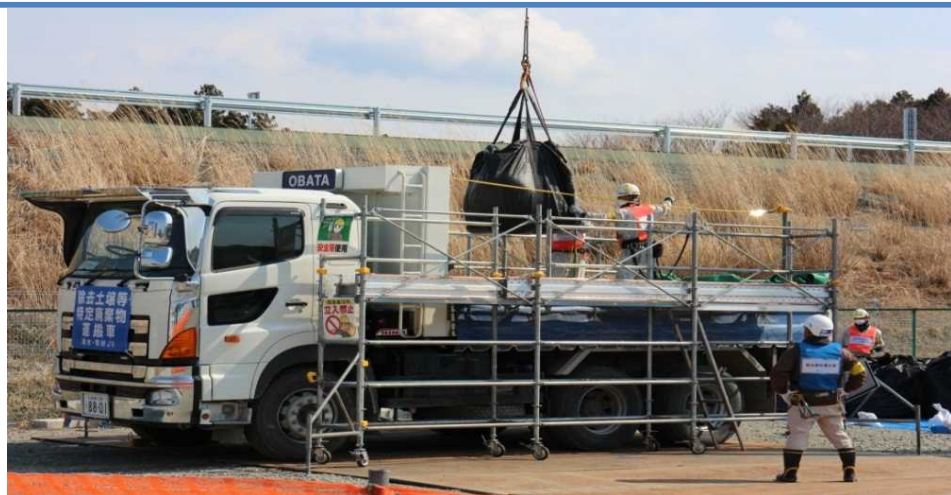
仮置場からの搬出作業

引き続き地元の御理解を得ながら、中間貯蔵施設の整備等を着実に実施することで、除染を迅速に進め、事故由来放射性物質による環境の汚染が人の健康又は生活環境に及ぼす影響を速やかに低減し、復興に資する。