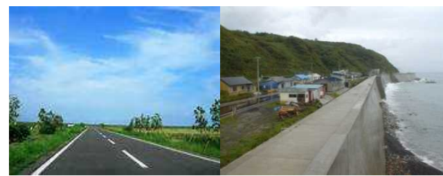
再生利用の例 (左:道路の路盤材、右:防潮堤の芯部)