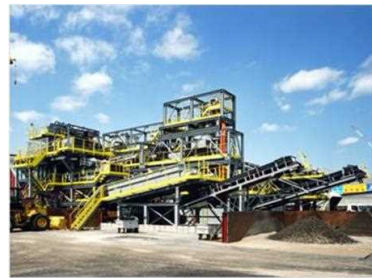
土壌分級プラントの例 (※)分級とは、セシウムが細粒分に付着しやすい特性を踏まえ、除去土壌をふるい等に加え、粒度別(シルト、粘土、砂、レキ)に分離する技術