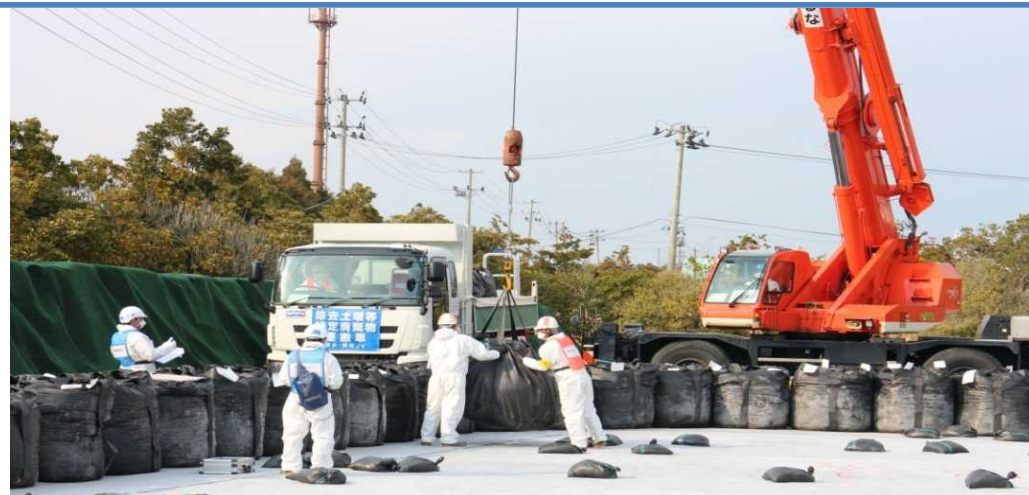
保管場への搬入・定置作業