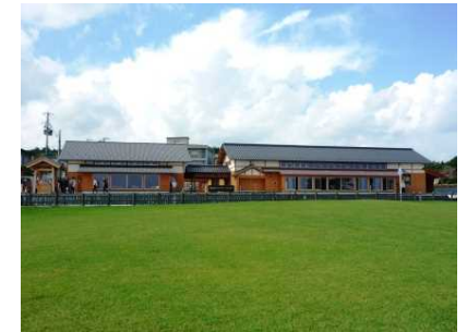
公園編入地域(青森県)の 集団施設地区整備 (種差海岸 インフォメーションセンター)