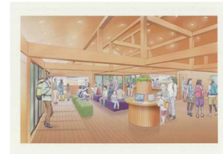
トレイルセンター (整備イメージ)