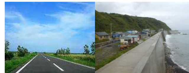
再生利用の例 (左：道路の路盤材、右：防潮堤の芯部)