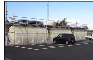
【応急仮設住宅に設置された浄化槽】