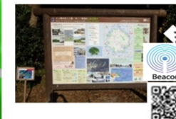
・園路の高質化、IT化 ・標識類の多言語化 (ITを活用した案内)