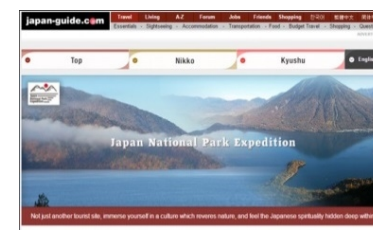
・海外プロモーション