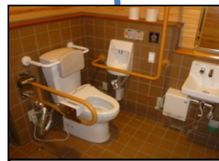
・トイレの洋式化、多機能化