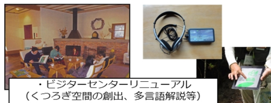
・ビジターセンターリニューアル (くつろぎ空間の創出、多言語解説等)