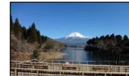
・魅力的な展望拠点 (ITを活用した解説等)