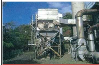
老朽化して休止した処理施設