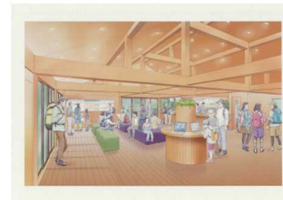
トレイルセンター (整備イメージ)