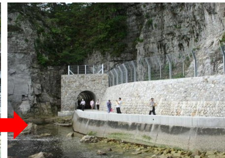
被災施設の復旧整備、供用開始 (浄土ヶ浜海岸歩道)