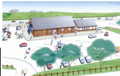
公園編入地域の集団施設地区 整備イメージ

被災した公園利用施設の復旧、観光の復興のための公園施設の整備、東北太平洋岸自然歩道(みちのく潮風トレイル)の利用拠点等整備