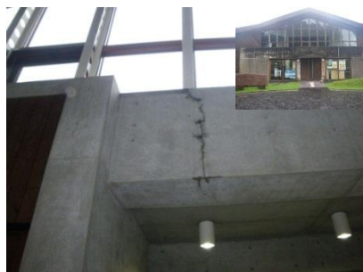
コンクリート梁の損傷 (屋久島世界遺産センター)