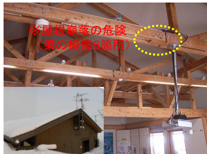
雪害による屋根・天井の破損 (宮島沼水鳥・湿地センター)