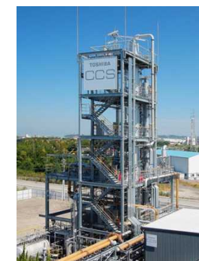
CCSパイロットプラント