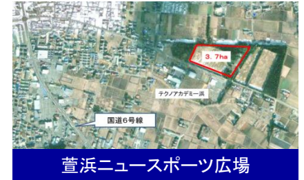
萱浜ニュースポーツ広場