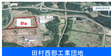
田村西部工業団地